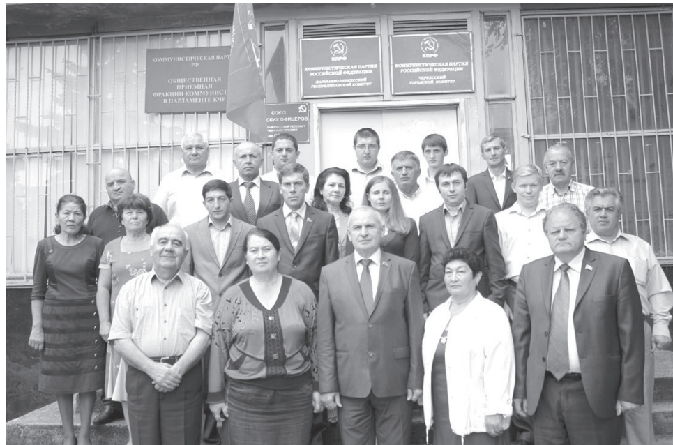
Группа коммунистов - кандидатов в депутаты Народного Собрания (Парламента) КЧР у республиканского комитета КПРФ

Наша цель добиться, чтобы наша малая Родина - Карачаево-Черкессия в составе великой России стала процветающей самодостаточной республикой, в которой обеспечены достойный уровень жизни населения, защищены права и свободы граждан.